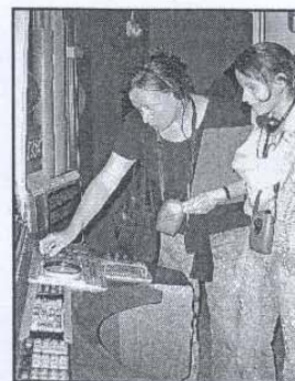
Le Musée de la communication était ouvert hier comme tous les jours de la semaine des mois d'avril à septembre, de 10 heures à 12 h 30 et de 14 h 30 à 18 h (jusqu'à 19 h du 15 juillet au 31 août)

également ponctué d'écrans plasma qui diffusent des images d'archives, des films d'époque et des documentaires. Les animations estivales (lire le programme ci-dessous) permettront de décliner le thème de l'image et du cinéma à l'envi, sous les angles technique, ludique et pédagogique. Par souci de clarification, les visites du professeur Di Namo, les ateliers « Comment ça marche ? » (le premier s'est